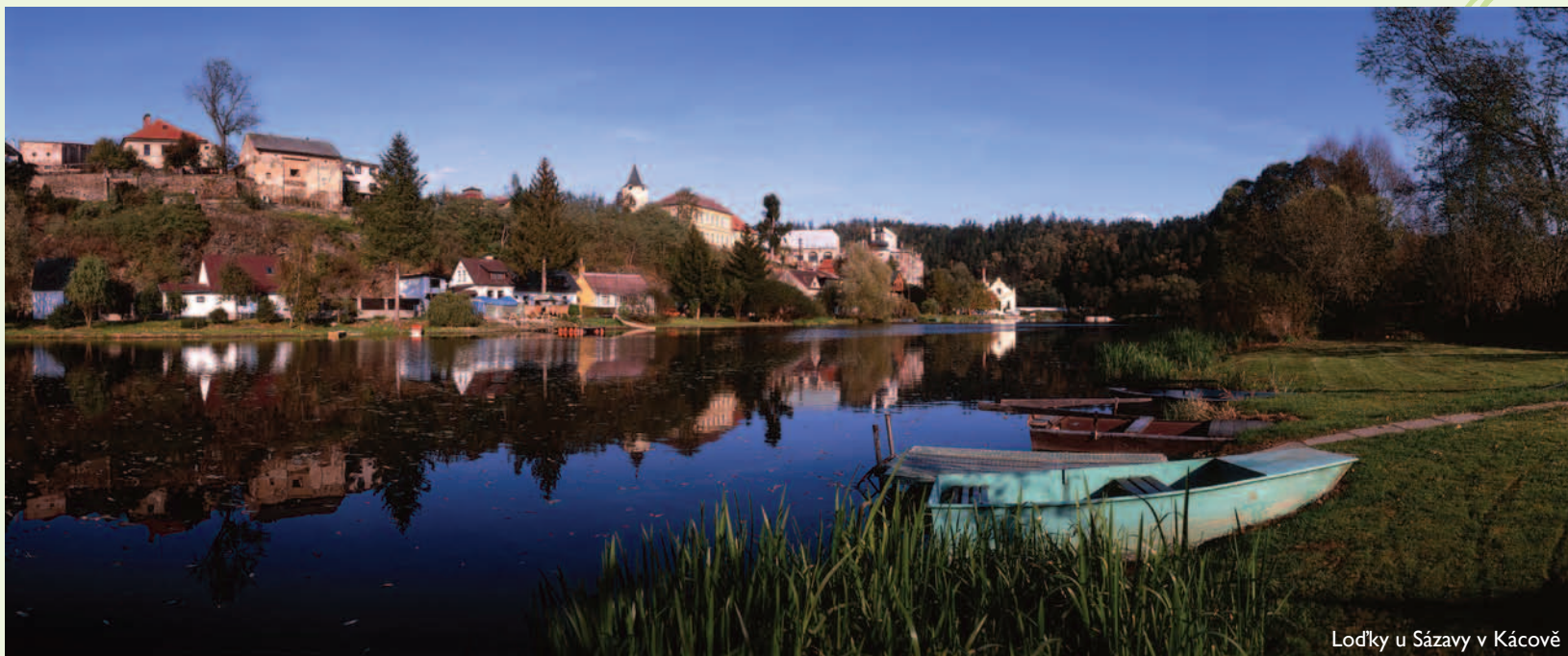
Lodky u Sázavy v Kácově