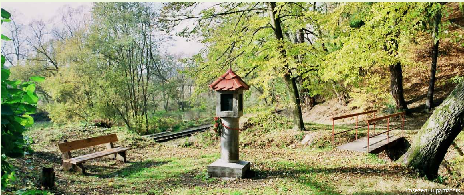
Posezení u památníku