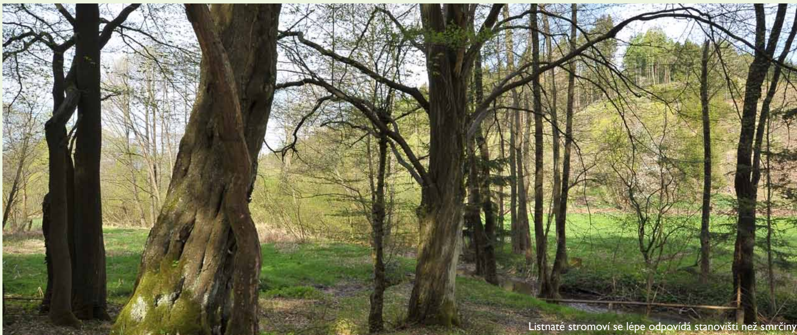
Listnaté stromové se lépe odpovídá stanovišti než smrčiny